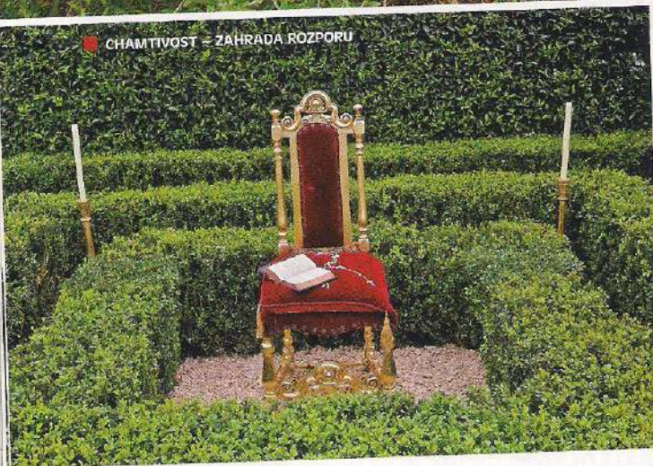
CHAMITVOST = ZÁHRADA ROZPORU

H ampton Court Palace leží v Londýně, ve čtvrti Richmond. V roce 1516 jej nechal postavit kardinál Wolsey, lord kancléř krále Jindřicha VIII. Přiliš si ho neužil. Král mu totiž, poté co u něj Wolsey v roce 1520 upadl v nemilost, palác zabavil, a následně jej rozšířil. V zahradách paláce se v minulosti procházel nejen král, ale i britská šlechta. I letos se na přehlídku květin, trávníků, rostlin, zahrad a strašáků do zelí na Hampton Court Palace Flower Show přijela podívat princezna Alexandra z Kentu, ctihodná Lady Ogilvy.