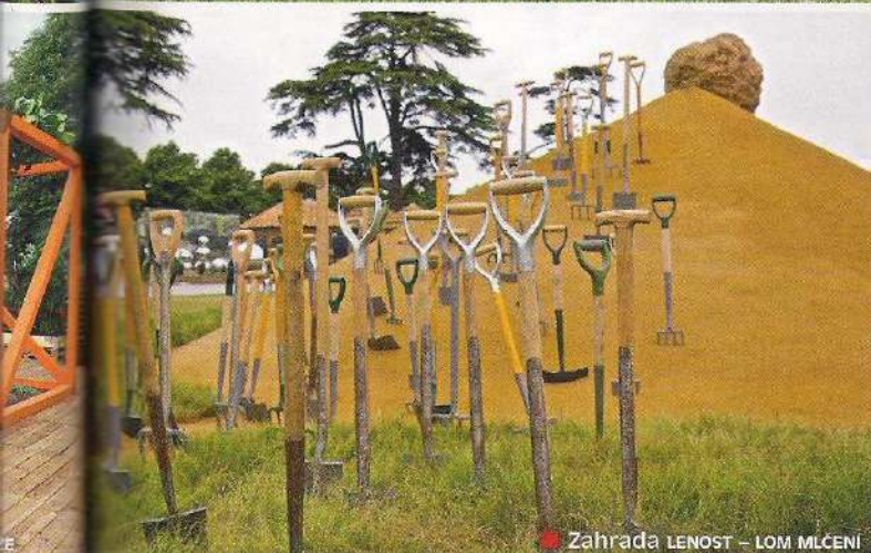
Zahrada LENOST – LOM MLČENÍ

Velká Británie je posedlá historií a také zahradničením. Obojí se tu propojuje na jedné z největších květinových přehlídek na světě. Každoročně se koná na téměř čtrnácti hektarech zahrad tudorovského paláce.