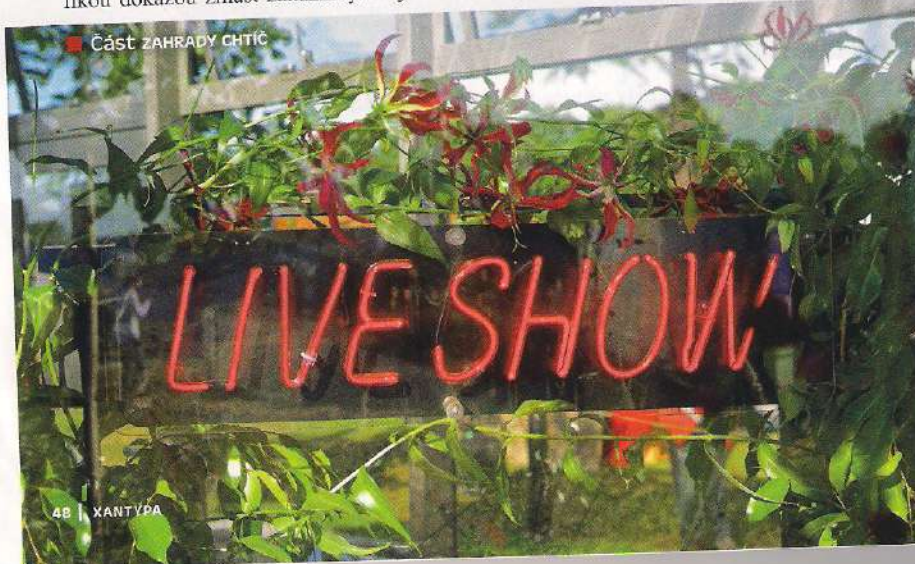
■ Část zahrady Ctiť

si, vyvolávající pocit, že člověk vždy touží po tom, čeho se mu nedostává. Zahrada pojmenovaná HNĚV – VÝBUCH NEZHOJENÉHO VZTEKU soptila dým a stříkala vodu, upozorňovala na sebepoškození, násilí a nestabilitu. Chamtivost znázorňovala v půli přehrazená zahrada s názvem CHAMTIVOST – Zahrada Rozporu , tvořící dva naprosto odlišné světy. Jedním byl malý labyrint z živého plotu vedoucí k pozlacené židli, v druhém byla dřevěná stolička a volně rostoucí tráva. Jiná zahrada pojmenovaná Zahrada Obstrukce – Boreni Zdi Pýchvy se skládala ze tří zdí, na jedné z nich bylo vidět oči mnoha lidí zavázané šátkem. Symbolizovaly neochotu přijmout jinou sexuální orientaci australské zahradní architektky. Možná také, že zeď vyjadřovala strach z předsudků. Malebná zahrada přede zdmi symbolizovala dosaženou svobodu.