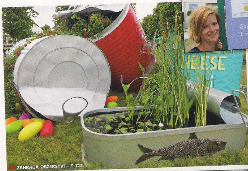
■ Zahrada Obžerství - E 123